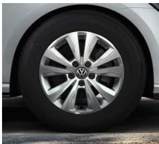
Toronto 6,5J x 16