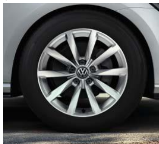
Dijon 7 J x 17